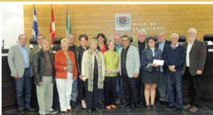
Photo des gagnants 2015