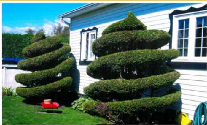
Photo du gagnant « Coup de cœur » au 115 rue du Parc (Rivière-Malbaie) qui a notamment se démarquer par l'originalité de son aménagement.

Parallèlement à ce dernier, la Ville de La Malbaie tient également à mentionner à ses citoyens que la prochaine évaluation de La Malbaie, dans le cadre des municipalités membres des « Fleurons du Québec », est prévue à l'été 2016. Par conséquent, tous les efforts sont déployés pour atteindre l'objectif d'un quatrième fleuron alors qu'il manquait quelques points pour y arriver lors de la plus récente évaluation en 2013.