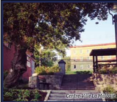
Centre-Ville La Malbaie

* Prenez note que la Ville fera une surveillance accrue au cours de l'hiver pour faire respecter son règlement.