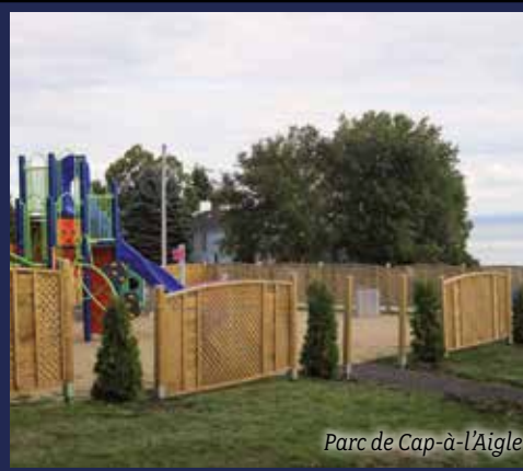
Parc de Cap-à-l'Aigle